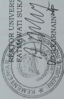
REKTOR UNIVERSITAS ISLAM NEGERI FATMAWATI SUKARNO BENGKULU,