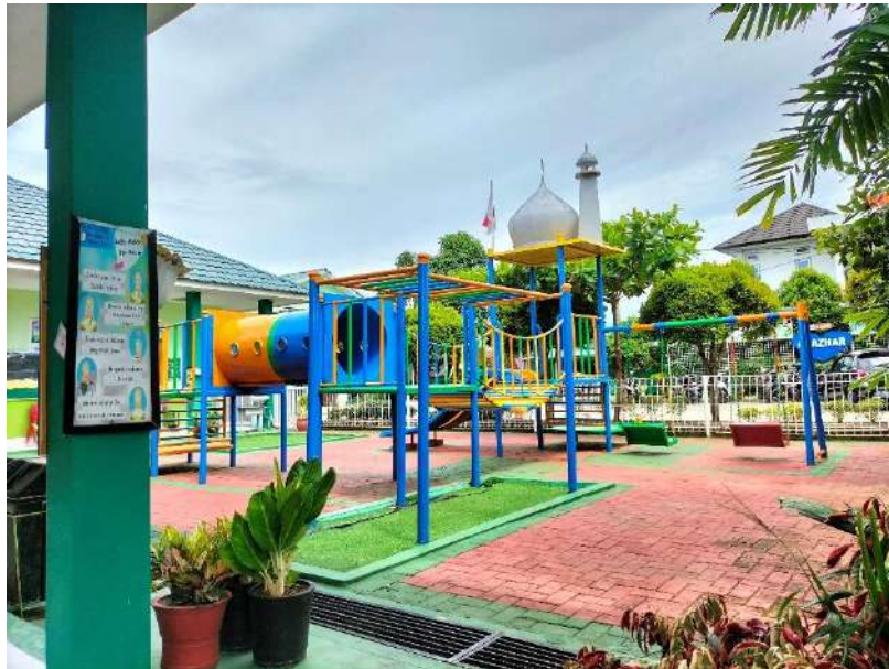
Gambar 13. Papan Visi, Misi, dan Tujuan Sekolah