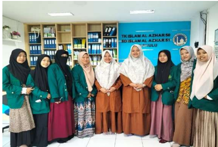
Gambar 2. Foto Penyerahan Mahasiswa PLP I

manfaat kultur sekolah, pemanfaatan sarana dan prasarana, manajemen sekolah, dan proses pembelajaran.