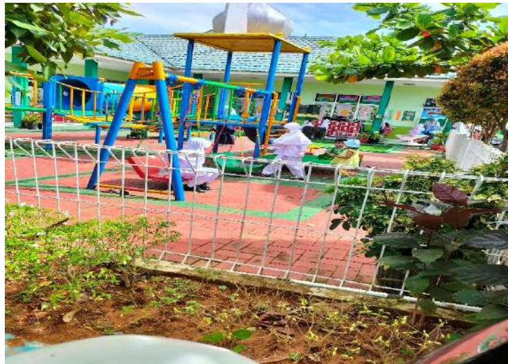
Gambar 1. Foto Peninjauan Lokasi PLP

Pada hari pertama tepatnya hari Jum'at 27 Januari 2023, PLP I diisi dengan kegiatan meninjau lokasi atau tempat pelaksanaan kegiatan PLP yang bertempat di TK Islam Al Azhar 50 Bengkulu. Dengan tujuan mengenal dengan baik seluruh aspek yang ada di sekolah dan mendapat pemahaman serta keterampilan mengenai