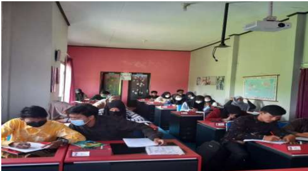
Gambar 2. Proses pengambilan data mahasiswa/i IAIN Curup