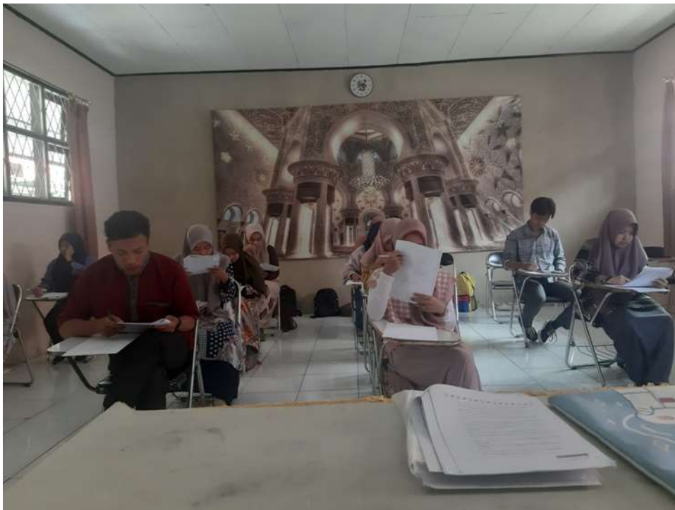
Gambar 6. Pengambilan data di IAIN Curup