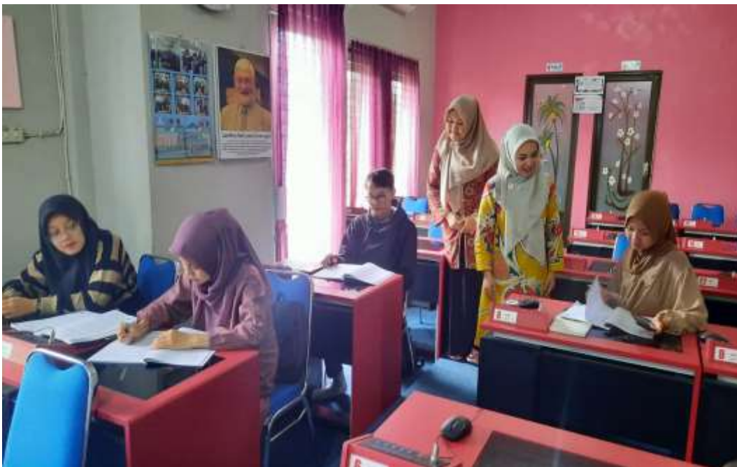
Gambar 4. Pengambilan Data Penelitian bersama dosen PBI dan mahasiswa-i di UPT Bahasa IAIN Curup