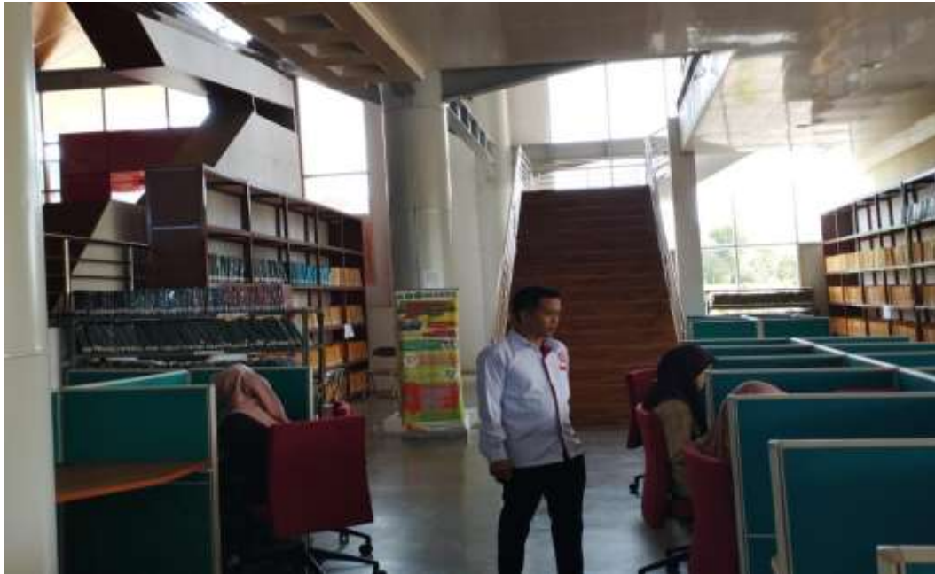
Gambar 3. Pengambilan Data Penelitian di Perpustakaan UIN FAS Bengkulu