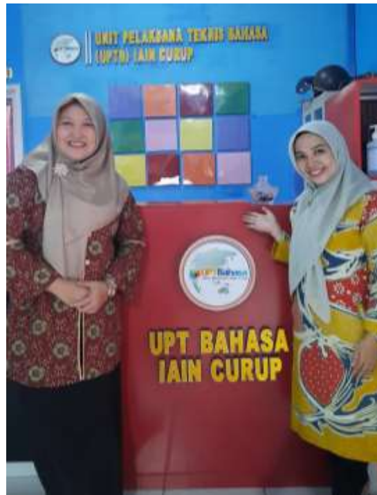
Gambar 1. Bersama Ka UPTB IAIN Curup