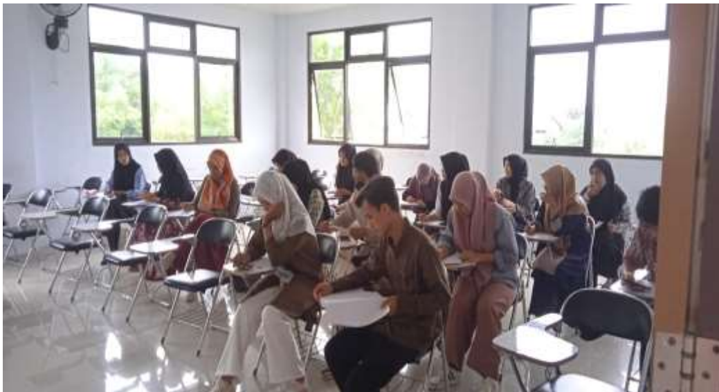
Gambar 8. Proses pengambilan data mahasiswa/i TBI UIN FAS Bengkulu