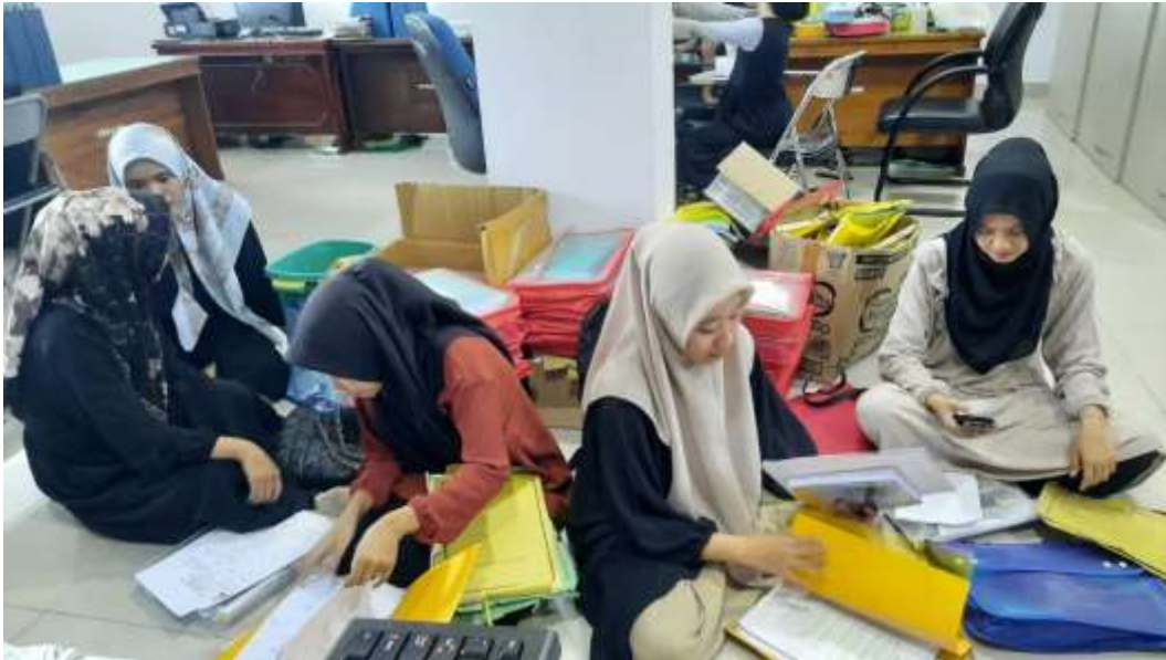
Gambar 7. Kegiatan sebelum pengambilan data di UIN FAS Bengkulu