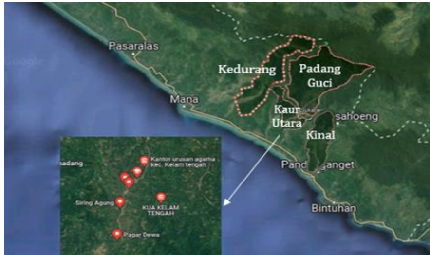
Gambar 1. Peta Sebaran Masyarakat Pasemah