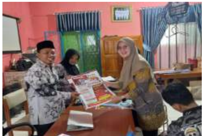
Gambar Penyerahan Souvenir