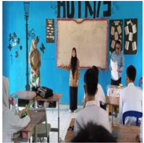
Gambar Sosialisasi dikelas