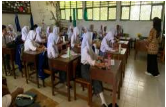
Koordinasi dengan pihak sekolah dan sosialisasi dikelas