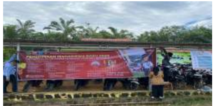
Gambar Pemasangan Spanduk