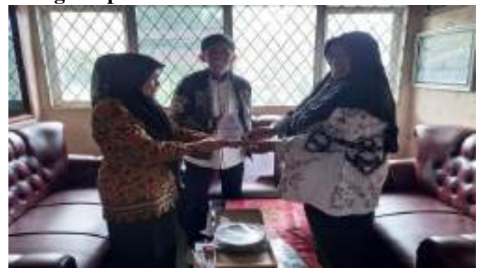
Gambar Penyerahan Cenderamata