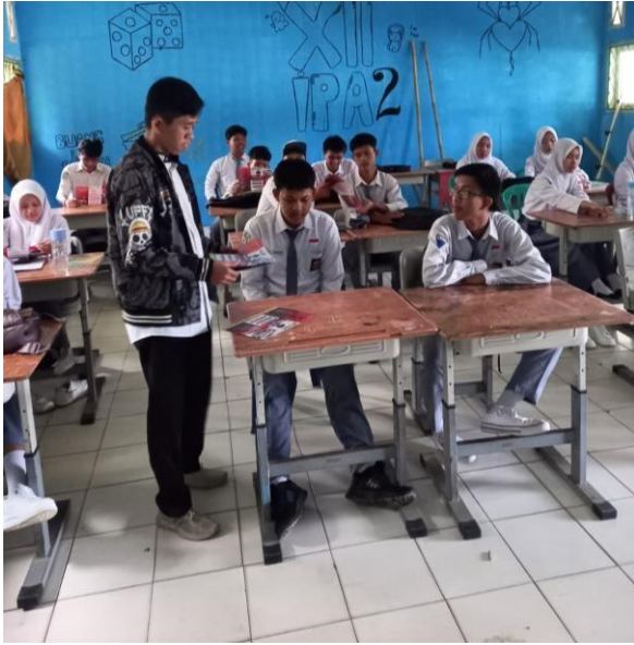
Gambar Sosialisasi dikelas