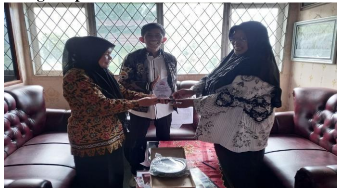
Gambar Penyerahan Cenderamata