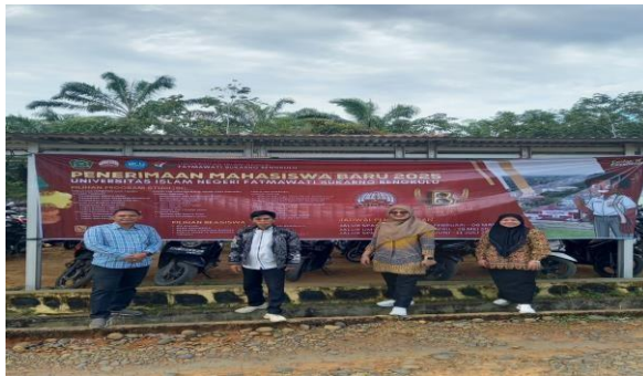
Gambar Pemasangan Spanduk