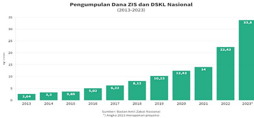
Gambar 1.4 Grafik Pengumpulan Dana ZIS Dan DSKL Nasional