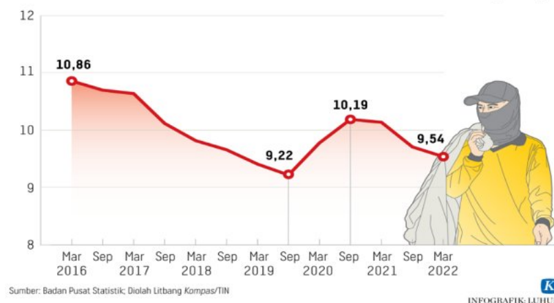
Tren Persentase Penduduk Miskin Indonesia Tahun 2016-2022 (persen)