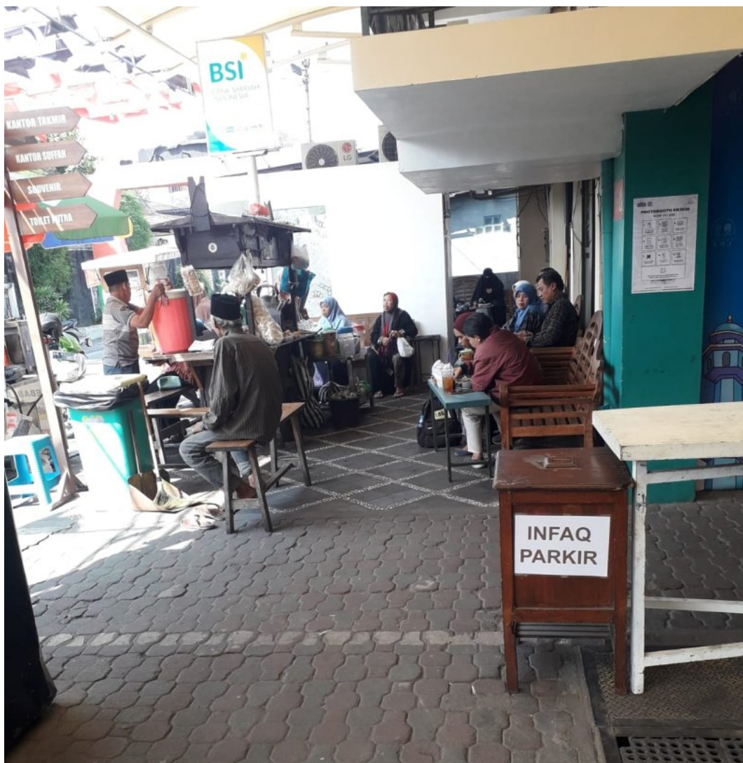
Gambar 5.1. Lokasi Penempatan Angkringan di Masjid Jogokariyan Yogyakarta. Terlihat bahwa Angkringan ditempatkan pada sisi luar gerbang masjid.

Rupanya perdebatan hukum Islam ini tidak dipersoalkan oleh pengelola Masjid Jogokariyan Yogyakarta, dan angkringan tetap berjalan hingga saat penelitian ini selesai dilakukan. Ada beberapa alasan yang dari beberapa pihak untuk meneruskan angkringan tetap beroperasi. Pertama , posisi angkringan terletak di samping luar dekat pintu gerbang masjid sebelah pojok kanan sehingga bisa dikatakan berada di luar masjid (Lihat Gambar 5.1.).