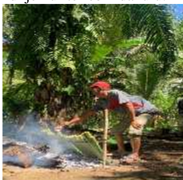
Gambar 2. Memasak Lemang