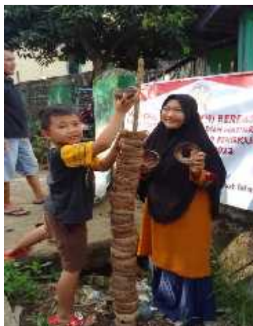
Gambar 1. Penyusunan Gunung Api atau Tempurung Kelapa